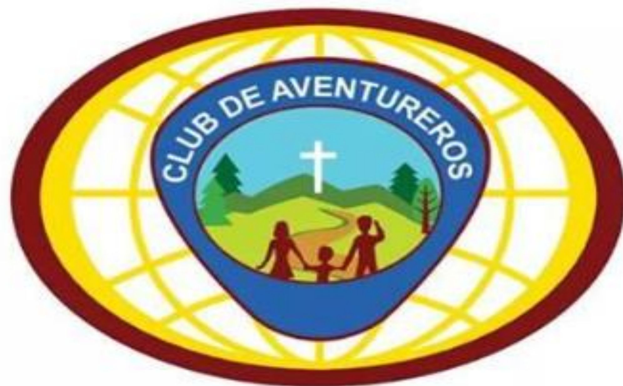
Logo Mundial del Club de Aventureros Todo Color

Club mundial: Esta versión debe ser usado por líderes para representar el Club de Aventureros como una institución mundial.