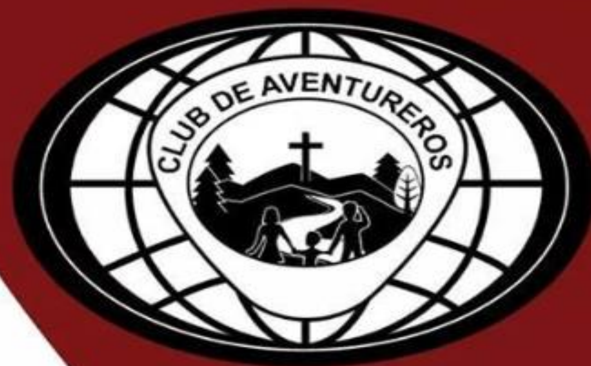
Logo Mundial del Club de Aventureros Un Color